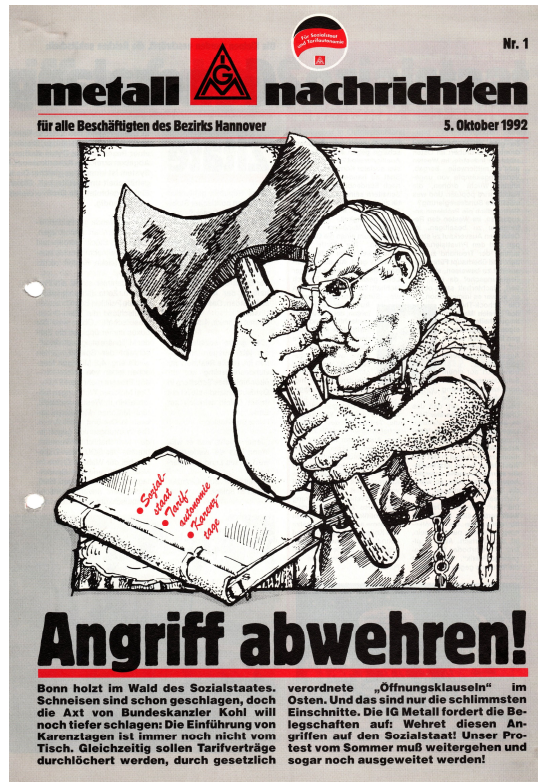
Aktivitäten der Metaller in den 90er Jahren