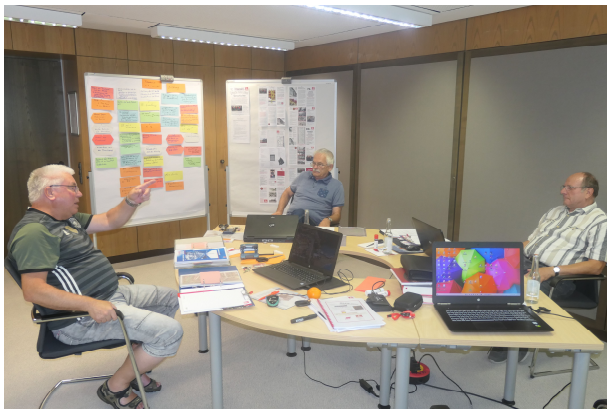
3 Arbeitsgruppenmitglieder bei der Konzepterarbeitung in Berlin